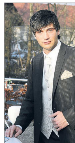
Auch der Bräutigam kommt natürlich nicht zu kurz.

Bei einem Hochzeitsgewinnspiel kommen wertvolle Preise der Aussteller zur Verlosung. Hier können die Brautpaare schon die Grundlage für ihr Hochzeitsfest gewinnen.