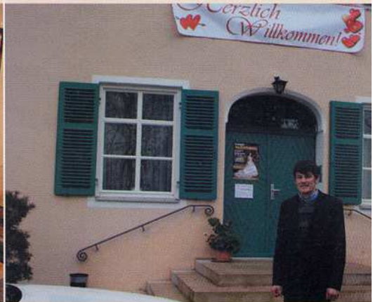
Veranstalter Frank Berndt