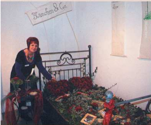
Blümchen & Co.