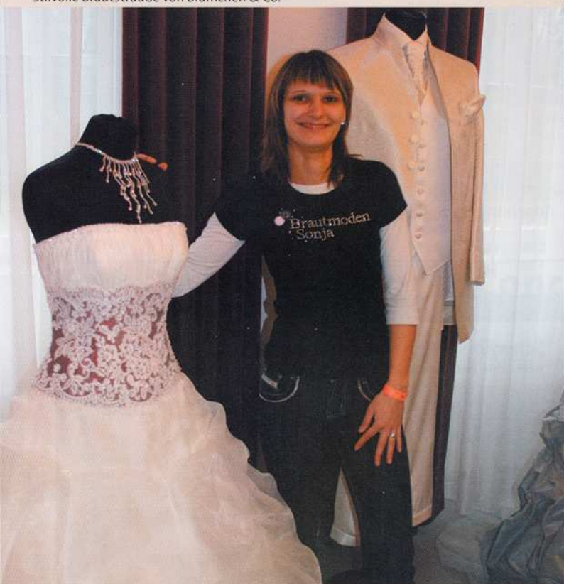
Hochzeitskleider von Brautmoden Sonja