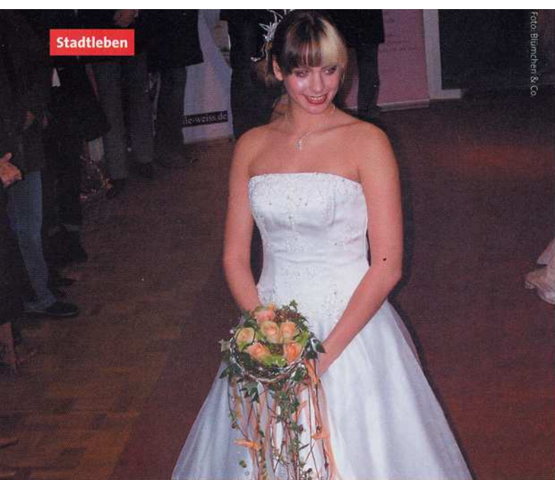
Stilvolle Brautsträuße von Blümchen & Co.