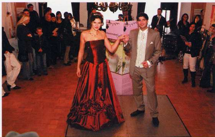
Brautmode für Sie und Ihn

Carl-Benz-Straße 4 96558 Hohenwart-Gewerbepark Tel: 08443/91 63 63 (Telefonische Terminvereinbarung)