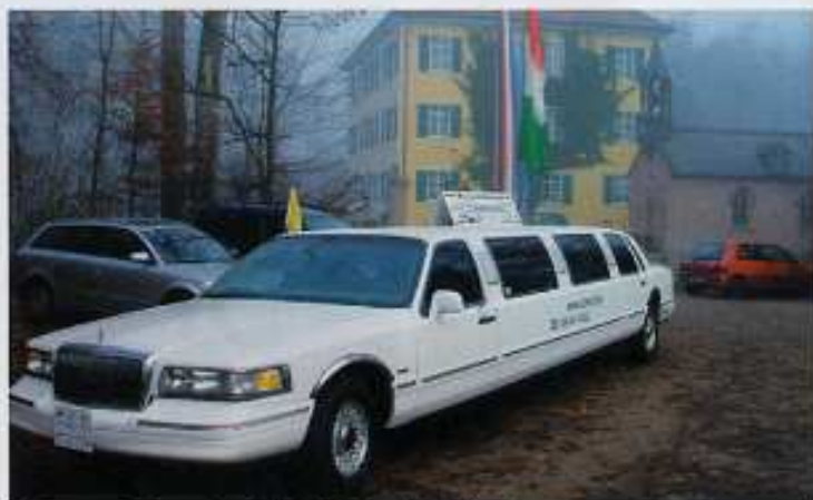
Mal etwas Besonderes für die Fahrt in die Kirche.