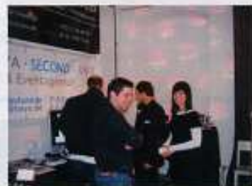
Sie wollen sich um nichts kümmern? Dann sind Sie bei der Eventagentur beya second unit genau richtig.