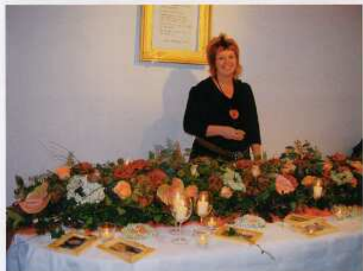
Bei Blümchen u.Co. gibt es traumhafte Dekorationsideen.