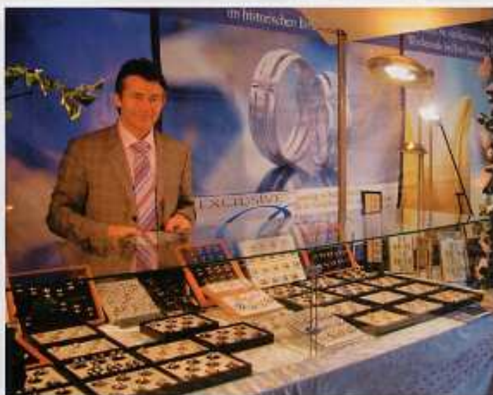
Exclusive Berg Collections präsentierte auf der Hochzeitsmesse wunderschönen Schmuck. Der Großteil der Schmuckteile an Hochzeiten sind Einzelanfertigungen.