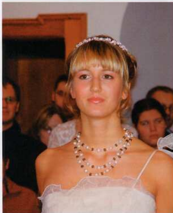
Auf die Details kommt es an: Perlen von der Perlenoase.